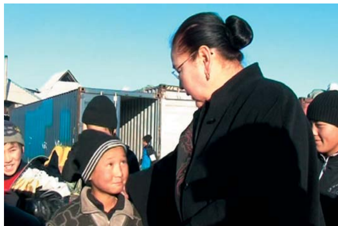
Министр социальной защиты КР Айгуль Рыскулова посетила рынок Дордой с целью мониторинга детского труда