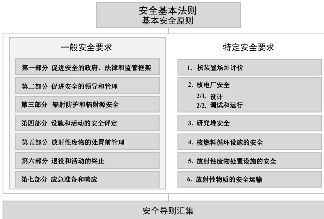
图 1. 国际原子能机构《安全标准丛书》的长期结构。

原子能机构安全标准反映了有关保护人类和环境免受电离辐射有害影响的高水平安全在构成要素方面的国际共识。这些安全标准以原子能机构《安全标准丛书》的形式印发，该丛书分以下三类（见图 1）。