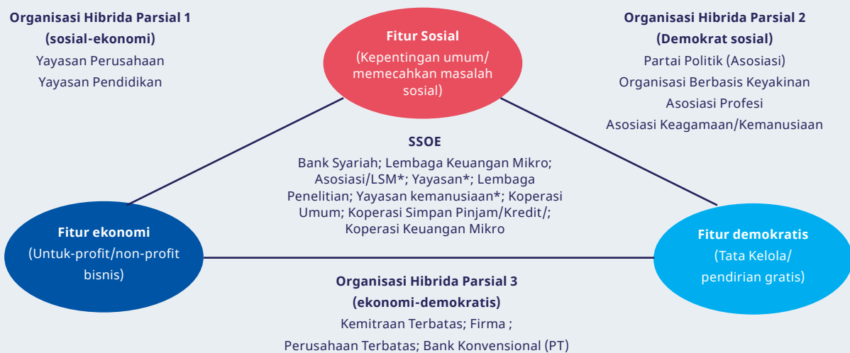
Gambar 1. Pemetaan SSEOE di Indonesia

Studi ini menilai 28 jenis organisasi, baik entitas pemerintah maupun swasta. Hasil penelitian menunjukkan bahwa 10 dari 28 organisasi memenuhi ketiga kriteria tersebut dan dapat diklasifikasikan sebagai SSEOE. 10 organisasi lainnya adalah Dinas Kesehatan (lihat Gambar 1). Tujuh organisasi, disebut sebagai 'Lainnya', hanya memenuhi satu kriteria. 4 Bentuk-bentuk organisasi ESS yang menonjol termasuk koperasi, asosiasi, yayasan dan bentuk-bentuk usaha sosial tertentu yang didirikan sebagai perusahaan swasta.