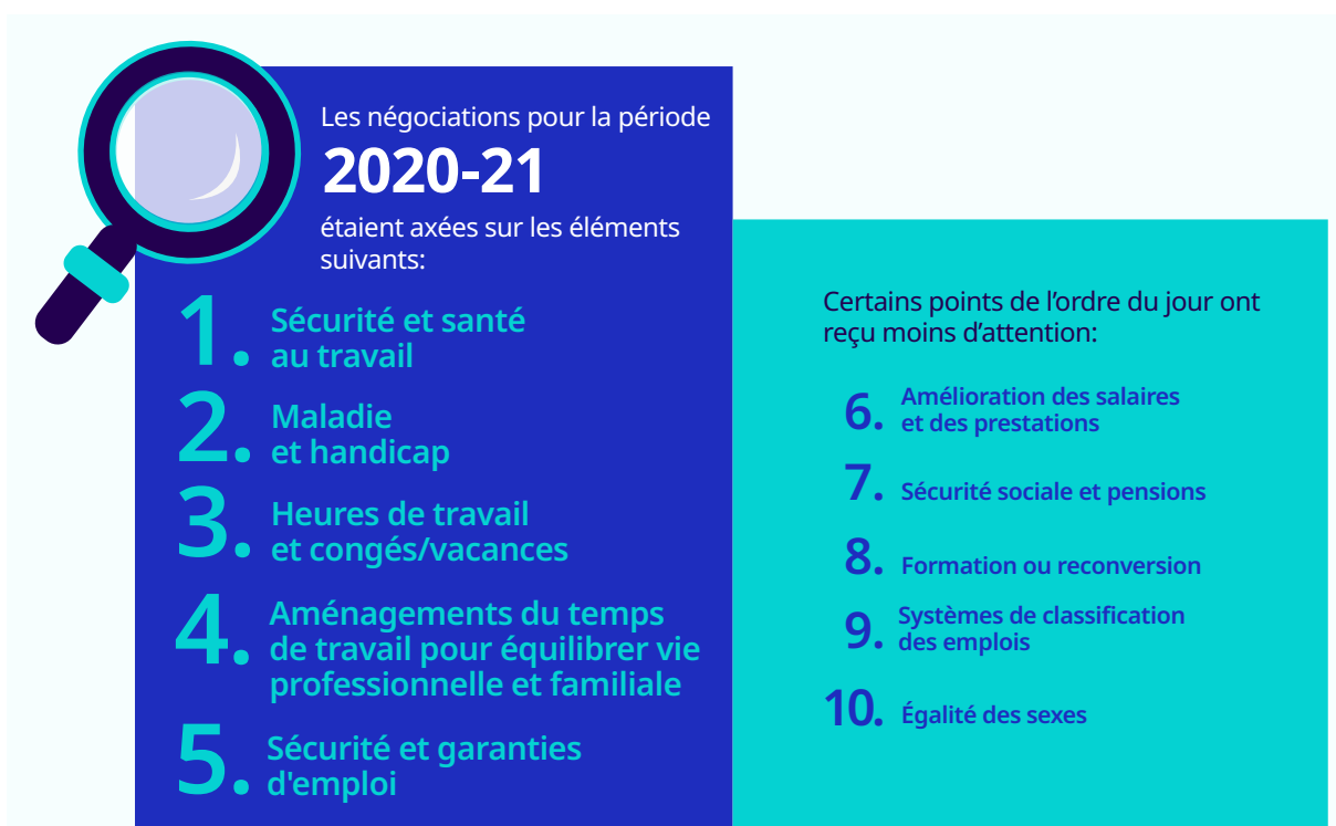
► Figure RA.2 Changement de priorités dans l'agenda des négociations collectives (2020-21)