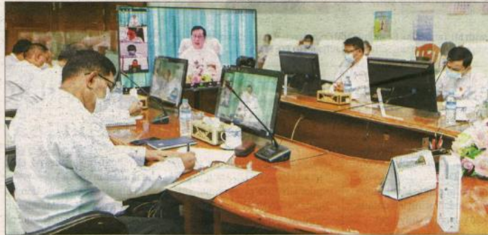
Union Minister U Thein Swe attends an online meeting to discuss the ILO Convention-138 concerning Minimum Age for Admission to Employment.

At the discussion, the Union Minister said that they will disseminate capacity building and knowledge to all the relevant parties to support and implement the convention, and that it was a process which should be done; the responsible officials from the ministry did the own research on the Minimum Age Convention and it had been