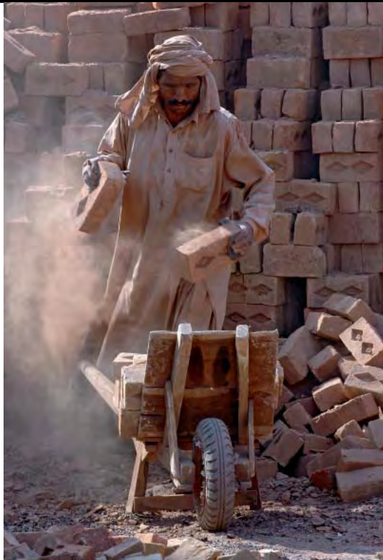
អង្គការពលកម្មអន្តរជាតិ ខិតខំ ដោះស្រាយ គ្រប់ ទិដ្ឋភាពទាំងអស់នៃ ការងារដោយបង្ខំ

អង្គការពលកម្មអន្តរជាតិ ក៏កំពុងជំរុញអោយមានច្បាប់ជាតិដែលមានប្រសិទ្ធភាព និងយន្តការ ពង្រឹងការអនុវត្តច្បាប់ ដែលខ្លាំងក្លាជាងមុនផងដែរដូចជា ទណ្ឌកម្មតាមផ្លូវច្បាប់ និងការដាក់ ទោសលើអ្នកដែលកេងប្រវ័ញ្ចពលករដែលត្រូវបានគេបង្ខំ។ តាមរយៈការលើកកម្ពស់ការយល់ដឹង អង្គការពលកម្មអន្តរជាតិព្យាយាមបញ្ជាំងអោយឃើញពីការរំលោភបំពានសិទ្ធិមនុស្ស និងសិទ្ធិ ការងារបែបនេះ។